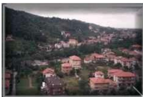
Rivarola di Carasco

Reducida así Egeria a habitar en Chiavari, y crecidos en edad sus hijos, no transcurre gran tiempo en edificar casa y adquirir terrenos de modo que pudieron prosperar y propagarse en modo que apenas un siglo después ya formaban entre ellos distintas familias. De todo esto existen las pruebas en los muchos instrumentos por ellos estipulados, y que pueden encontrarse en los protocolos de los antiguos Notarios de Chiavari: así como en el laudo que los Cónsules de Génova en el día 15 de abril del año 1208 dieron a los Chiavareses, en virtud del cual venia entre los repartos de terrenos fuera del muro en el lado de Oriente de 186 parcelas al objeto de edificarlas. De las cuales resulta, que entre otras fueron concedidas cuatro parcelas a Guglielmo de Rubeis “per se et fratem”.