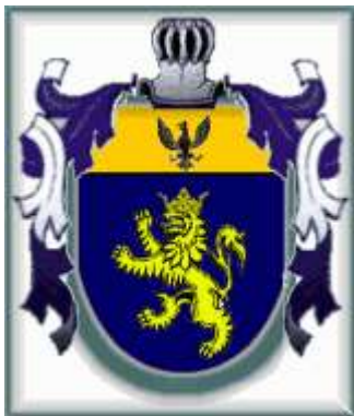
Tercer escudo (1764) Príncipe di Roccella

Madrid - Año 2000 (Revisión: Madrid 2010)