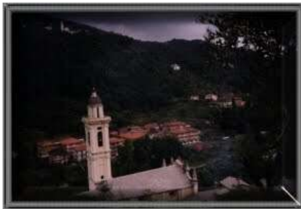
Iglesia de Rivarola