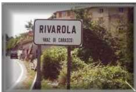
Entrada a Rivarola de Carasco

En todo caso es un hecho probado de que Guglielmo de Rossi fue el que da el nombre de Rivarolo al Castillo por él construido en Liguria, y de que después de destruido, el nombre Rivarolo quedo a la circundante localidad y, de que con el pasar del tiempo se cambia la última vocal de o en a pasándose así a llamarla Rivarola (4)